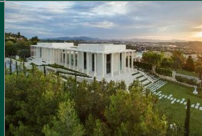
Arkas Sanat Urla

Urla üzerine söylenecek çok şey bulunmaktadır. Limantepe kazılarında, M.Ö. 3000'den kalma zeytin tanelerini ezme için kullanılan küçük el havanları, öğütme taşları, zeytinyağını karasudan ayırmaya yarayan seramik kaplar ve daha sonraki dönemlere ait zeytinyağı depoları bulunmuştur.