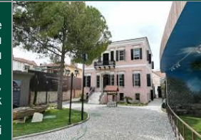
Urla Kent Tarihi ve Arşivi (UKTA) Müzesi

Urla'nın tarihi ve kültürel değerlerinin, gelenek ve göreneklerinin derlenip kayıt altına alındığı UKTA Müzesi, 2023 yılının Mayıs ayından ziyaretçilere açılmıştır. İlçenin eski