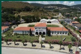
Ankara Üniversitesi Mustafa Vehbi Koç Deniz Arkeolojisi Araştırma Merkezi

Yaklaşık olarak İzmir merkeze 40 km uzaklıkta bulunan Urla'ya çok kolay şekilde ulaşım sağlayabilirsiniz. Özel aracınızın yanında toplu taşıma araçlarını da kullanarak varmanız mümkündür. Urla gezilecek yerleri, tarihi, doğal ve kültürel güzellikleri oldukça fazladır. Tarih boyunca farklı medeniyetler tarafından önemli bir yer olarak kabul edilmiş Urla, antik kalıntıları ile tarihsel yolculuk yapmanıza da yardımcı olmaktadır. Urla'da sanat ve kültür de önemli bir yer tutmaktadır. Urla plajları ve gizli kalmış koyları ile huzurlu bir deniz tatili gerçekleştirilebilir. Plajların birçoğu mavi bayraklı plajlardır.