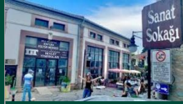
Urla Sanat Sokağı

çalışmalarında büyük öneme sahip restorasyon laboratuvarı, depo alanı, ulusal ve uluslararası ölçekte araştırmalara ev sahipliği yapması hedeflenen bir kütüphane, bölgeye hizmet verecek konferans salonu, antik dönemlerden günümüze uzanan denizcilik teknolojilerindeki gelişmeleri yansıtan canlandırmaların sergileneceği 4 dönümlük sergileme alanları ile projelerde çalışan katılımcıların barınabilmesi için 30 kişi kapasiteli yatakhane bulunmaktadır.