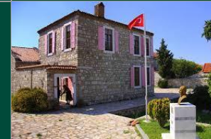
Necati Cumalı Anı ve Kültür Evi

yolcu gemileri ile özellikle kuzey hac yolu için gelen hacılar için düşünülmüş ve 1950 yılına kadar aktif kalmıştır. 150 yıl önce inşa edilen ve ölümcül hastalıklara ilk müdahalenin yapıldığı tahaffuzhane, dönemin en ileri sağlık merkezlerinin başında gelmektedir.