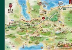
Urla Bağ Yolu

yapılarından olan tarihi Arditi Köşkü (Eski Tekel Binası) gerçekleştirilen mimari tasarım ve uygulamalarla restore edilerek, modern bir müze anlayışı doğrultusunda UKTA Müzesi için bir arşiv ve sergi alanı olarak yeniden tasarlanmıştır.